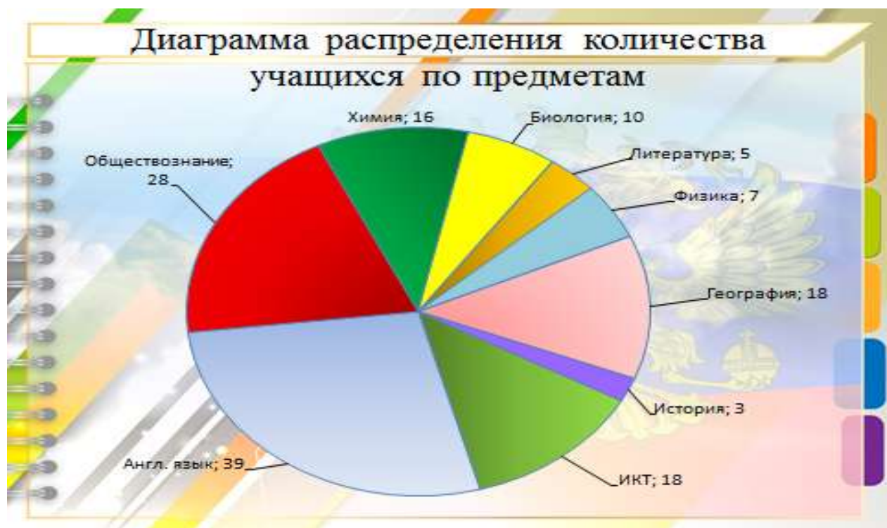
Диаграмма 1. Распределение количества учащихся в выборе предметов для сдачи ОГЭ в 9 классах в 2019 году.

Основным показателем качества являются результаты независимых контрольных процедур по завершении уровня основного и общего среднего образования (ВПР, ОГЭ, ЕГЭ), а также итоги участия учащихся в интеллектуальных конкурсах. Результаты ОГЭ в 9 классах и результаты ЕГЭ в 11 классах представлены в диаграммах.